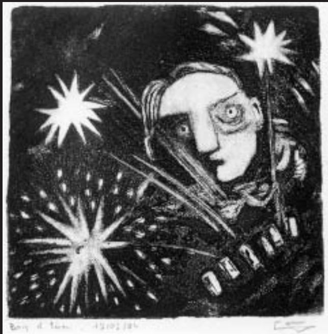
© Eric Langlamet, suite pour Olivier

10 artistes présentent leurs œuvres aux Ecuries : Boisgallays, Bricaut, Brugerolles, Frenkiel, Gillet, Gonzales, Kameyama, Langlamet, Maes, Pham